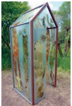
Broeikasje voor een mens