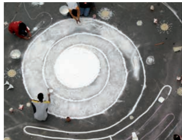
Time-Line: Overvloedig tijdsfenomeen