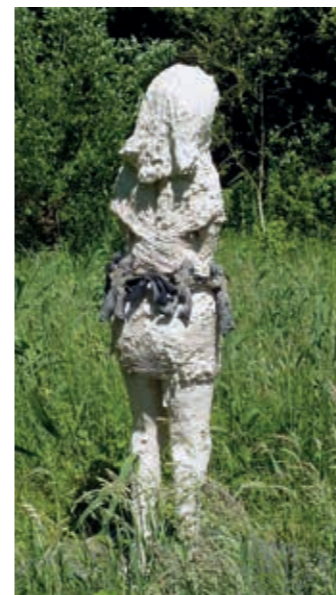
Snow White nr 7