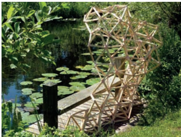
The Crystal Series

'Het groeiproces van een bevruchte eicel is fascinerend. Meestal gaan we hier aan voorbij omdat het moeilijk zichtbaar is. Door dit zo enorm uit te vergroten wordt het proces manifest. De "Eicel" die hier getoond wordt, past perfect bij het thema metamorfose en op de locatie van een appelboomgaard krijgt dit werk nog een extra lading.'