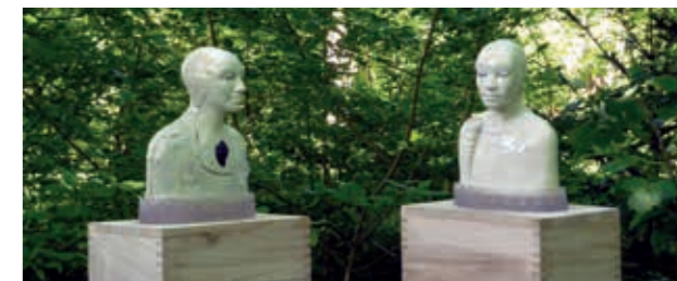
Myrrh and Frankincense en Cluster of Camphire