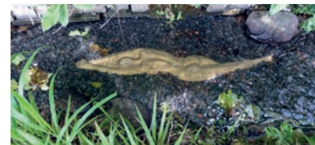
Shallow water poetry

kunstwerken een onderdeel van de omgeving. De 'Hand' is zo gemaakt dat je er doorheen kunt kijken.