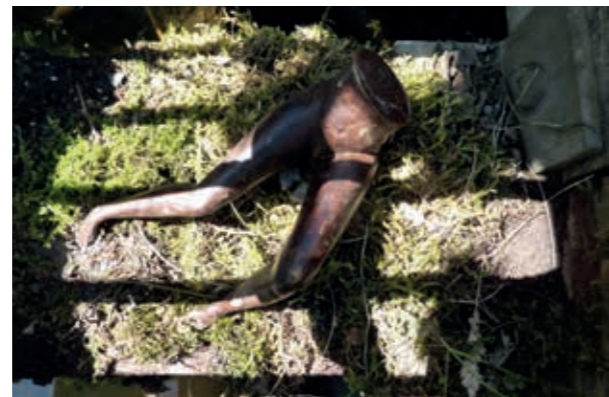
Soil of Ardour

'Deze twee aardmannen heb ik speciaal voor deze expositie gemaakt. De Heemtuin bestaat eigenlijk bij de gratie van de verschillende soorten aarde. Je zou ze de bewakers van deze unieke plek kunnen noemen.'