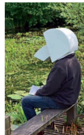
Instamatic – Bird View