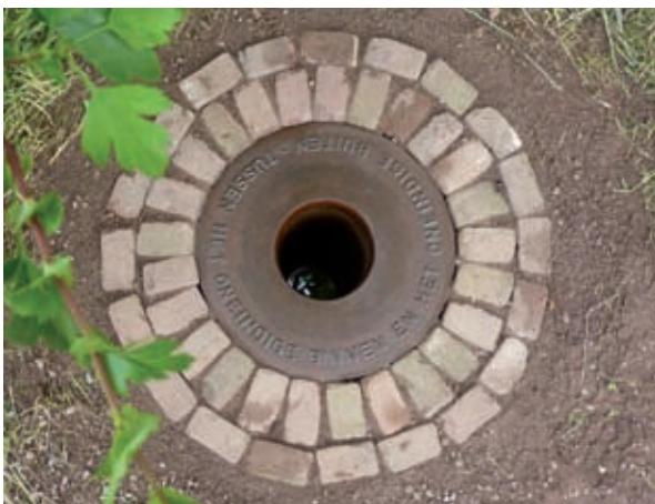
Tussen het oneindige binnen en het oneindige buiten

Pjotr Müller's werken zijn gebaseerd op een combinatie van architectuur, autonome sculptuur en landschapskunst.