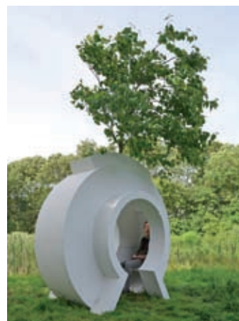
Contemplatorium – Love Tree

Kijkend door het object krijg je een blik op de bladeren en de bloemen, die op het water drijven.