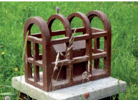
Architectuurstudie 1 t/m 7