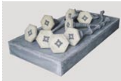
Flores de mi corazon