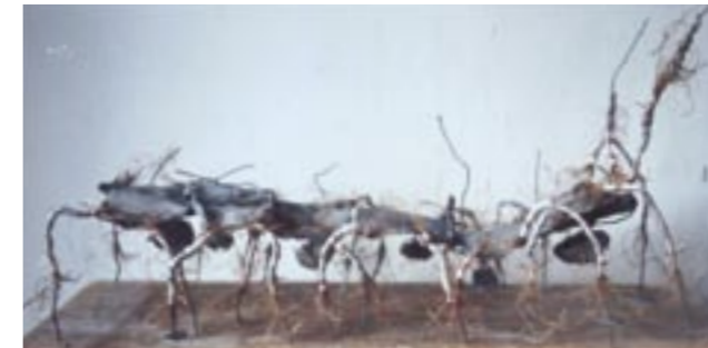
He walks like a crab

'Als mens leven we eigenlijk in twee werelden: werkelijkheid en fantasie. Vaak is de werkelijkheid hard en benauwend. Dan hebben we de fantasie nodig die onze geest prikkelt en verruimt. Daarom laat ik in deze tuin een Fantasiebeest los.'