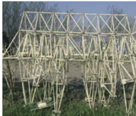
Animaris Currens Vaporis