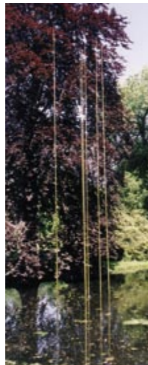
Op weg naar het licht

'Het beeld Op weg naar het licht is een heel minimalistisch beeld. Het zijn vijf lijnen die in het landschap staan. Vijf glimmende lijnen die op de wind bewegen, die zich spiegelen in het water en die het licht van de omgeving in zich opnemen. Je zou het gouden stengels kunnen noemen die in de aarde geworteld zijn, maar die ook proberen de aarde los te laten. Ze gaan als het ware op in het landschap. De wind, de zon, de lucht en water vormen eigenlijk een onderdeel van het beeld.'