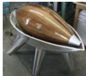
Diamond in the rough