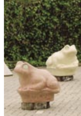
Het groene pad, de paddentrek