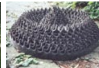
Deel van een groter geheel

Deel van een groter geheel | Vilt | 1994